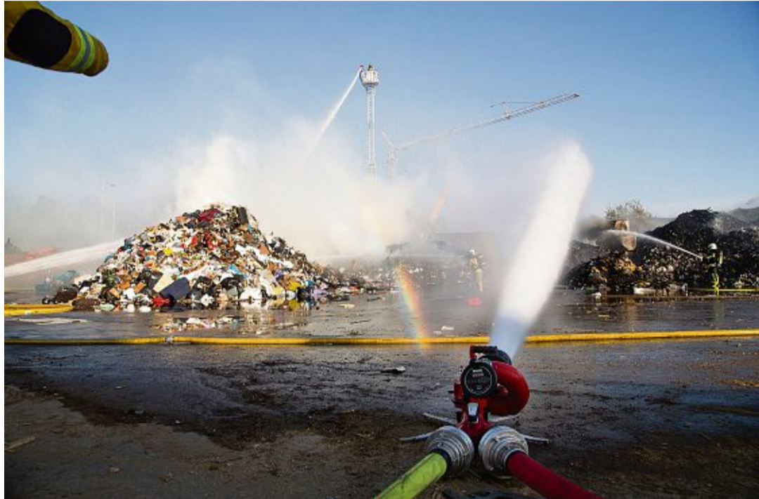
Un feu s'est déclaré chez Serbeco, usine de recyclage des déchets à Satigny, le 1 er août.

Les batteries au lithium ne devraient donc jamais se retrouver dans des piles de déchets divers et variés, mais plutôt être traitées séparément. Au problème de la combustion spontanée s'ajoute celui d'un feu très difficile à éteindre, et qui peut se rallumer après extinction. Selon Bertrand Girod, la